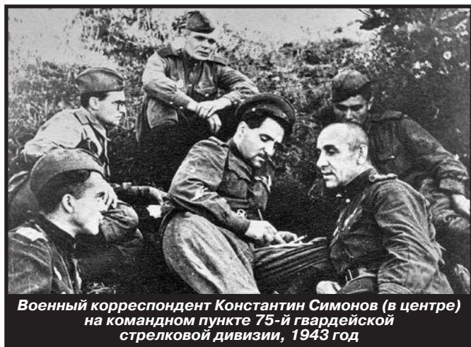
Военный корреспондент Константин Симонов (в центре) на командном пункте 75-й гвардейской стрелковой дивизии, 1943 год

В 1946 году печатают документальную повесть «В окопах Сталинграда» участника Сталинградской битвы Виктора Некрасова. Писатель Борис Васильев уходит на фронт добровольцем. После войны он напишет пронзи-