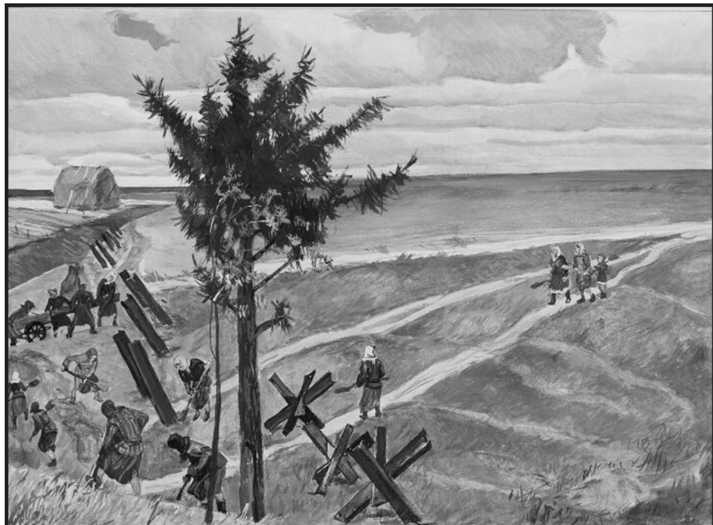
«Колхозники роют противотанковые рвы на подступах к Москве», Александр Дейнека, 1946–1947 – из собрания Государственной Третьяковской галереи

Писатель Константин Симонов работал военным корреспондентом. В декабре 1941 года публикует его стихотворение «Жди меня, и я вернусь...», ставшее своего рода гимном для солдат. Вернувшись к мирной жизни, Симонов пишет роман «Живые и мёртвые» (1959), основанный на собственных военных дневниках.